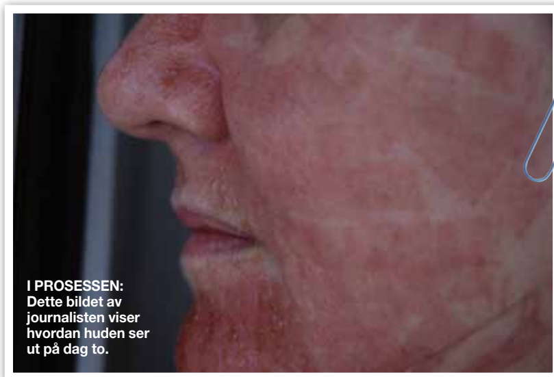
I PROSESSEN: Dette bildet av journalisten viser hvordan huden ser ut på dag to.

og utelukker ikke at hun vil gjenta behandlingen om noen år.